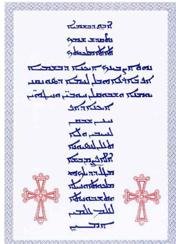
'Onze Vader' in het Aramees